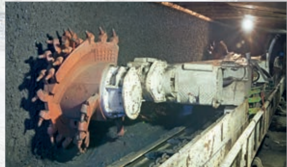
Der Abbau von Bodenschätzen wie Braunkohle ist nur mit robuster Fördertechnik möglich.

dieses Ziel effektiv und können den Wartungsaufwand deutlich verringern.